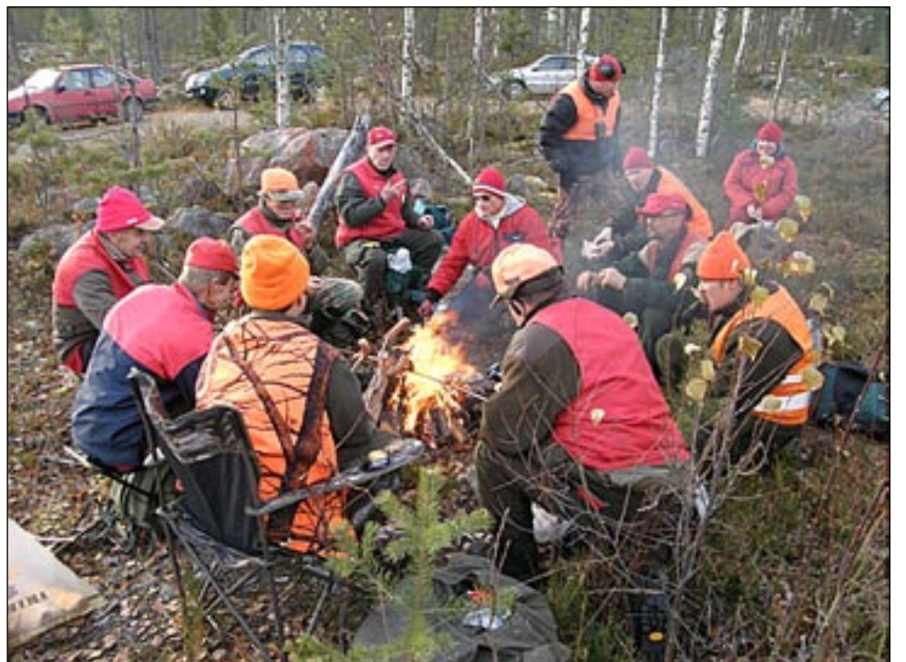
Kahvi- ja makkaratulilla "huuli lentää".