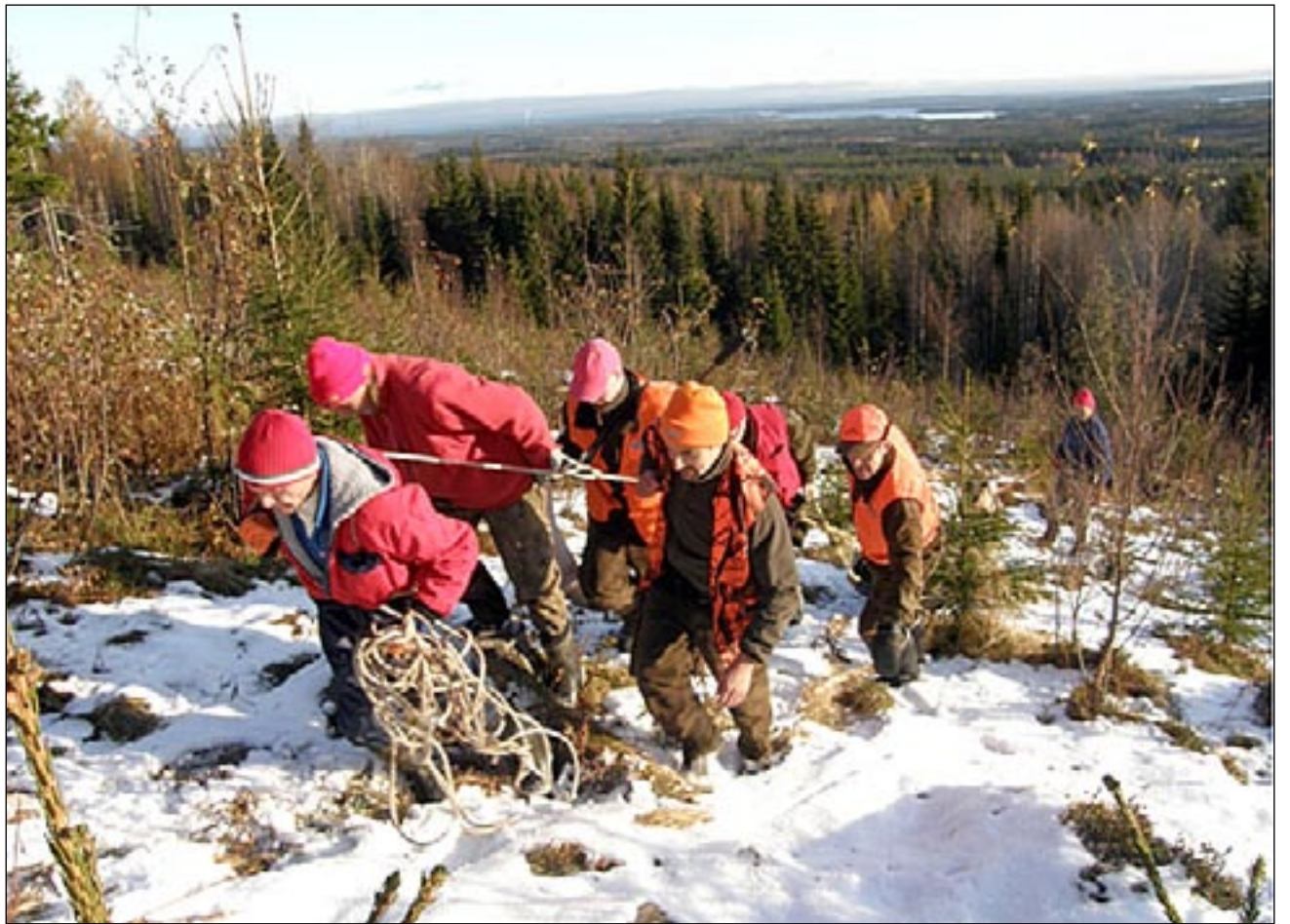
Yhdessä toimien homma hoituu.