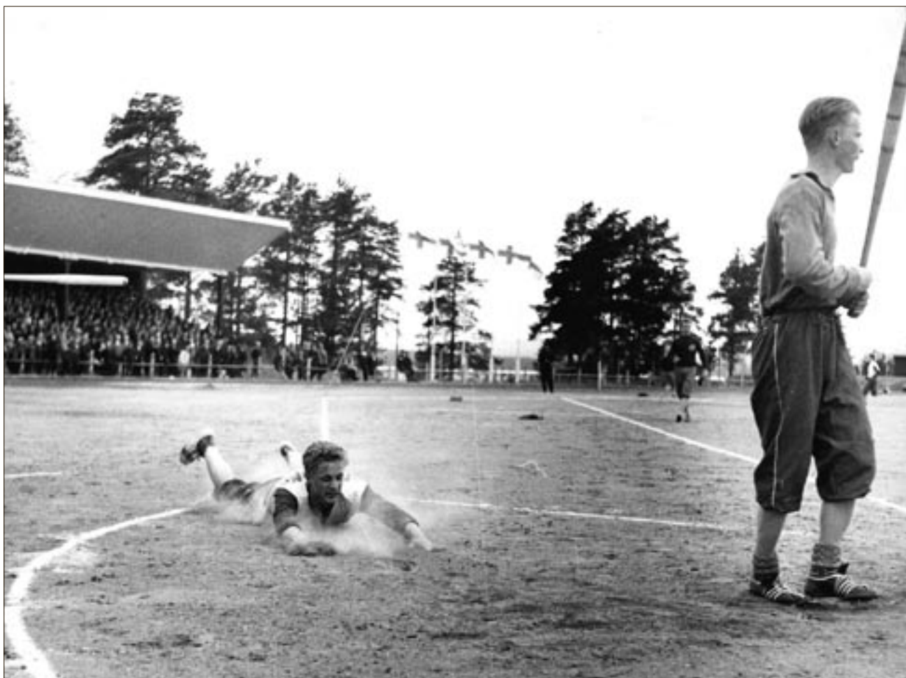
Sotkamon Jymy käväisi 1950- ja 60-lukujen taitteessa pesäpallon mestaruussarjassakin. Ensimmäinen mestaruus tuli 1962, mutta paikka ylimmällä sarjatasolla vakiintui 1980-luvulla. Kuva on noin 50 vuoden takaa.