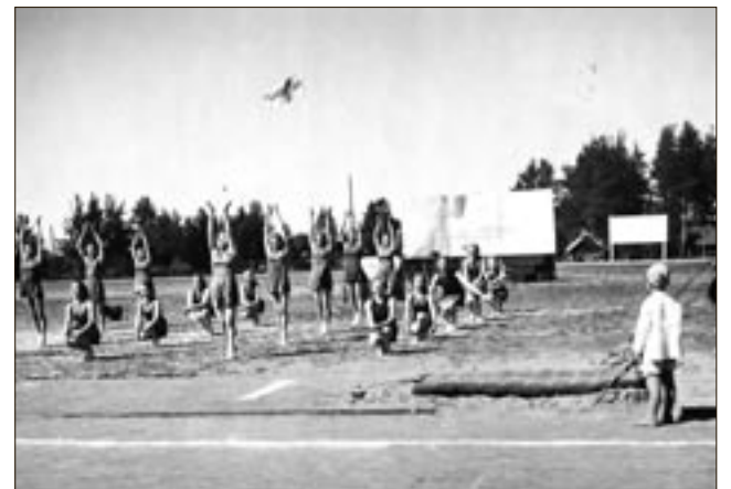
Naisvoimistelijat esiintyivät 40-vuotisjuhlassa 60 vuotta sitten.