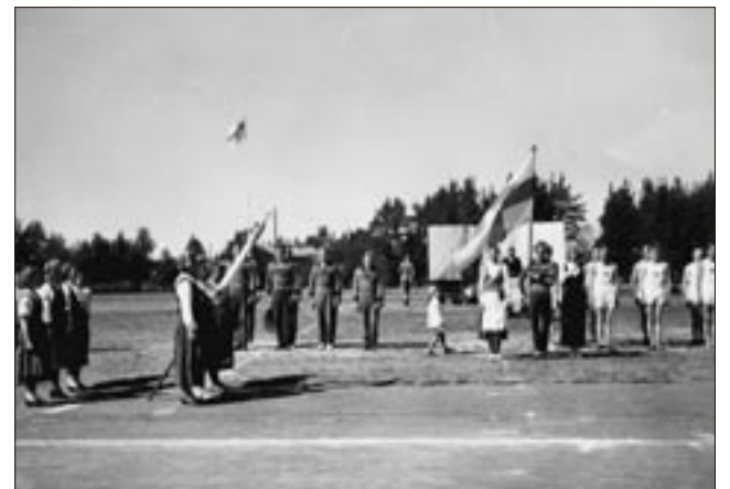
Sotkamon Jymy vietti 40-vuotisjuhlaansa urheilukentällä järjestetyssä tilaisuudessa vuonna 1949.