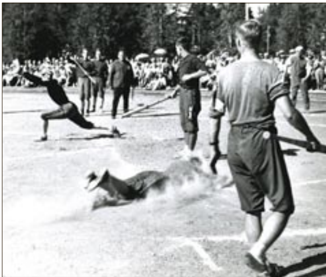
Sotkamon Jymyn pesäpalo-ottelu 1960-luvun alkupuolella.

menestystä seuralle ja kaikissa lajeissa on myös järjestetty isoja kansainvälisiä kilpailuja vuosien varrella.