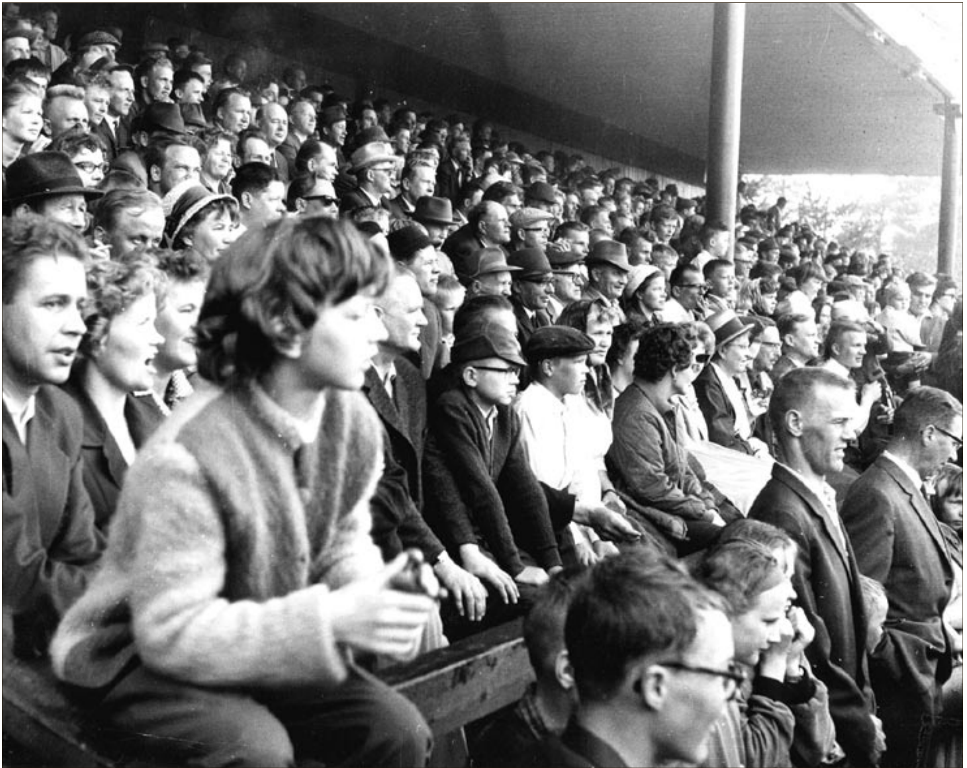
Sotkamon Jymyn pesäpalloyleisö eli mukana otteluissa jo viitisenkymmentä vuotta sitten.