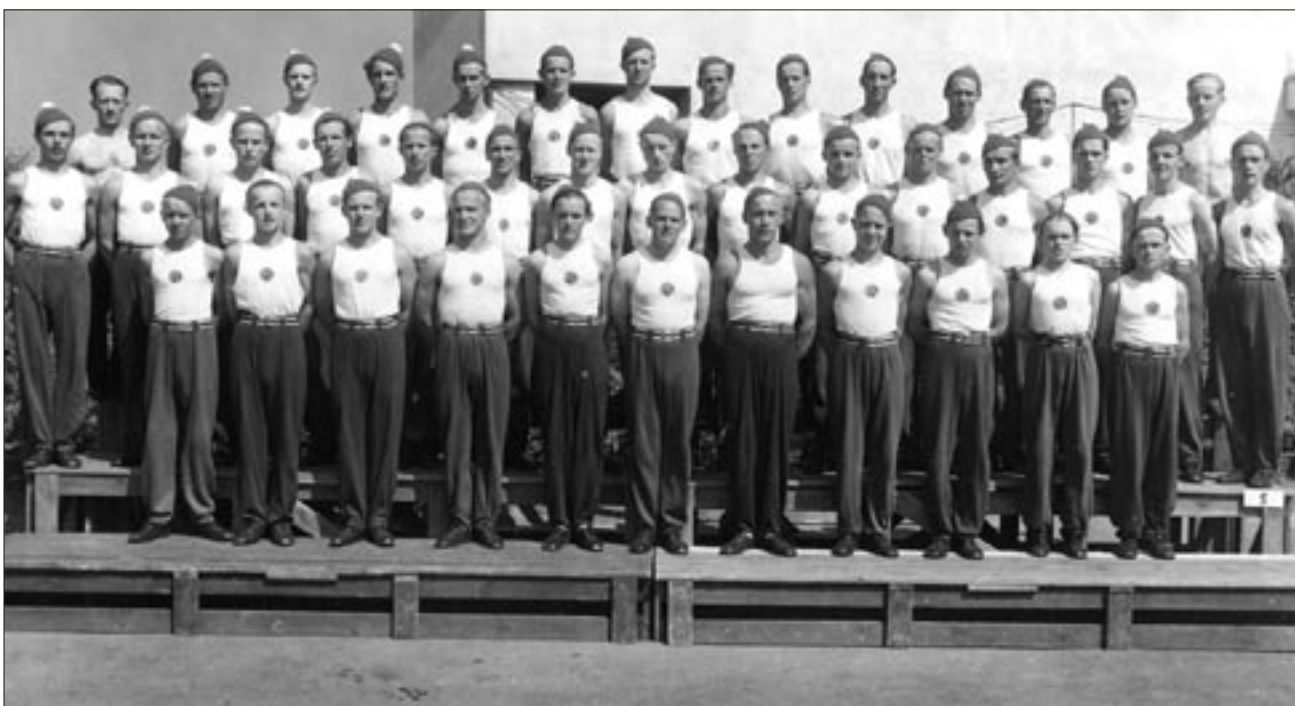
Jymyn miehet olivat suurella joukolla mukana vuoden 1947 suurkisoissa.