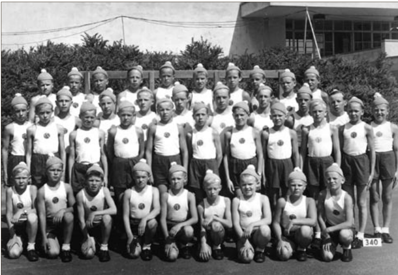
Sotkamon Jymy osallistui suurella joukolla vuoden 1947 suurkisoihin. Tässä seuraa edustaneet 11-16-vuotiaat pojat kuvattuna Helsingin Olympiastadionin lähellä.

Helsingissä kisojen aikana ostamani jäätelöt olivat todella maukasta jäätelöä, ja jälkepäin on todettava, että savolaiset eivät vielä silloin osanneet jäätelöä tehdä, tai muuten