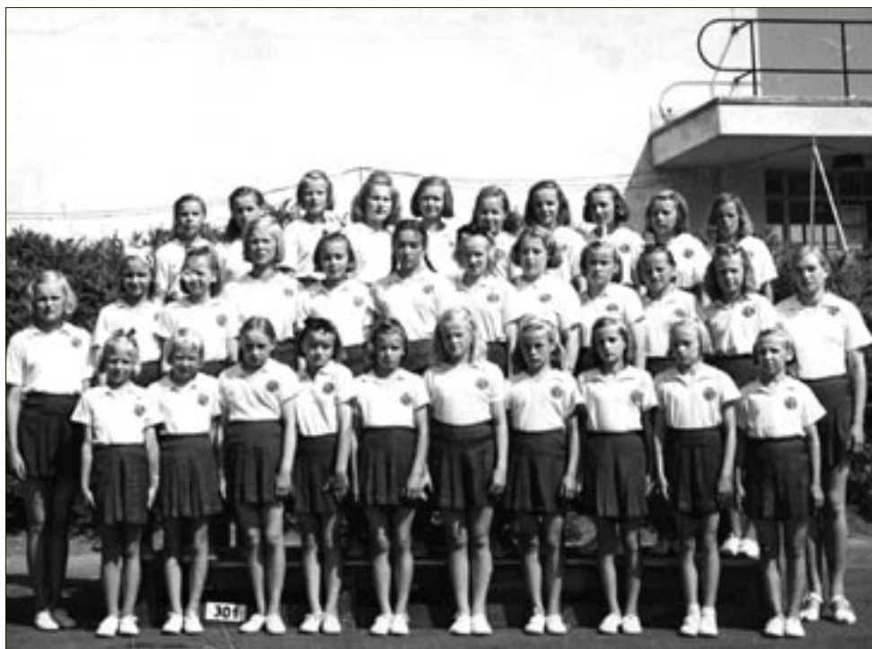
Jymyn tytöt suurkisoissa vuonna 1947.