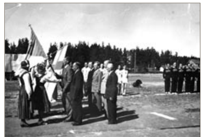
Jymyn 40-vuotisjuhlan juhlallisuuksia vuonna 1949.