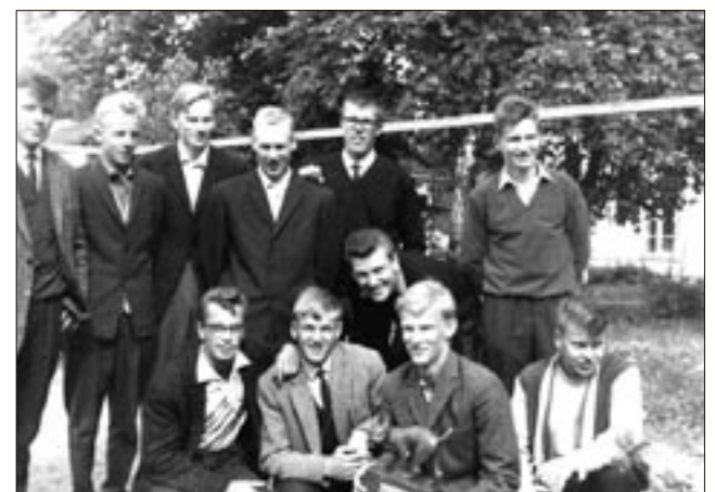
Pesäpallon Ilves- eli junioreiden Suomen mestarit mallia 1962.